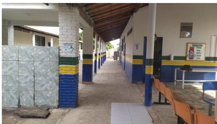
Figura 2: Área externa

O local hoje se encontra na seguinte situação: