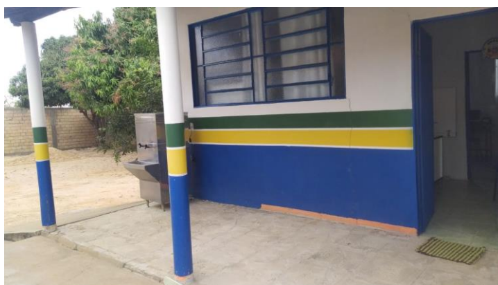
Figura 3: Área externa