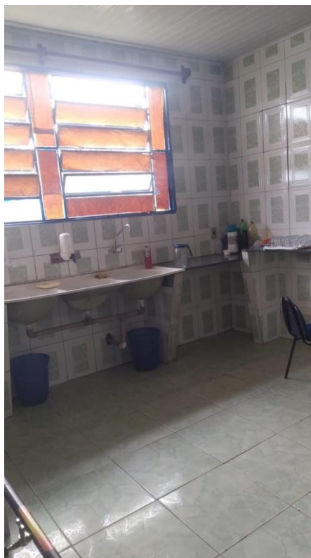
Figura 4: Cantina